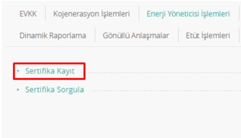
Sertifika Kayıt Seçme

Adım1: YEGM yetkilisi “ Enerji Yöneticisi İşlemleri ” menüsünden alt başlık olan “Sertifika Kayıt” seçeneğine tıklar.